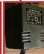
VOEDING ZWARTE DOOS